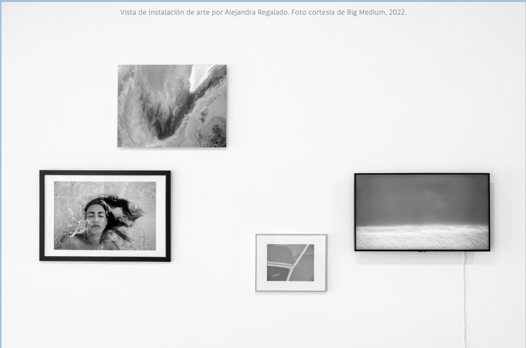
Vista de instalación de arte por Alejandra Regalado. Foto cortesía de Big Medium, 2022.