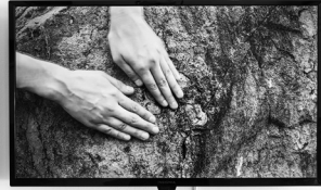
Vista de instalación de Registro Fósil / Fossil Records 01 por Melissa Aguirre.