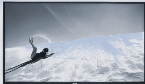
Vista de instalación de on the strange planet Earth por Alexa Capareda. Foto cortesía de Big Medium, 2022. / Imagen en duotono.

El microcosmos compuesto de los trabajos de estas artistas que existe dentro de la galería me abrió las puertas a perspectivas marginadas en los movimientos ambientales y conmigo se quedaron varias lecciones, las cuales incitan afinidad con la tierra y consecuentemente un entendimiento más compasivo de nosotros mismos.