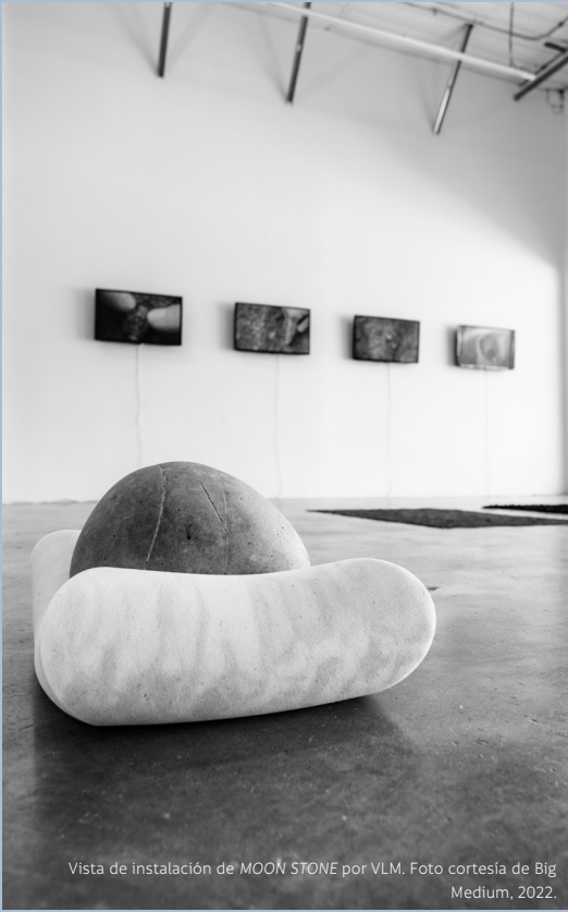
Vista de instalación de MOON STONE por VLM. Foto cortesía de Big Medium, 2022.