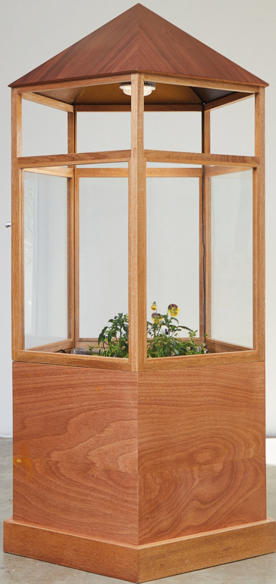
El mundo ha partido por Arturo Cerda / Invernadero de madera con sistema de riego, microcontrolador, luz de cultivo y plantas de pensamiento / 81 x 77 x 178 cm / 2022