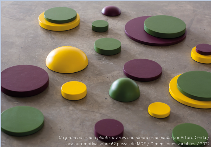
Un jardín no es una planta, a veces una planta es un jardín por Arturo Cerda / Laca automotiva sobre 62 piezas de MDF / Dimensiones variables / 2022